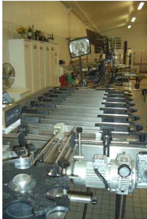
Abfülllinie mit „Warteschleife“ zum Ausdehnen der Korken

Pinot noir 2005 : einfacher Wein aber korrekt.